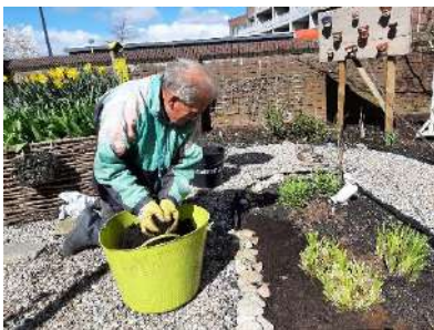
ook de tuin krijgt een voorjaarsbeurt